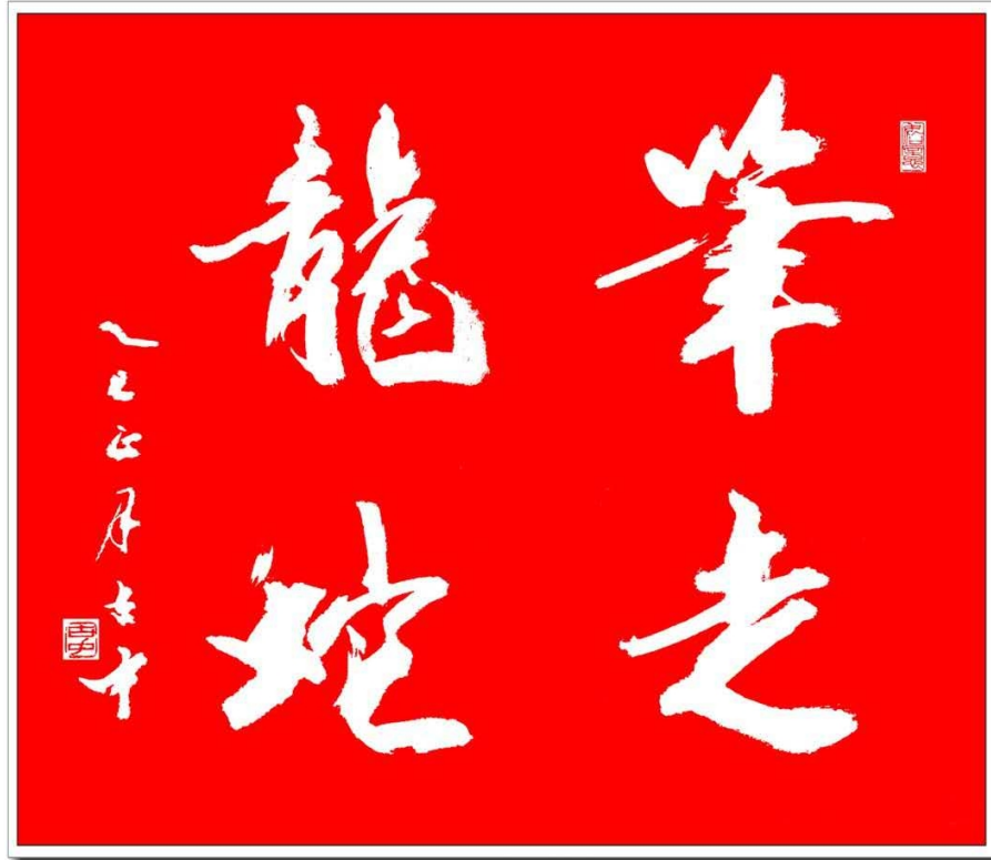
乙巳元宵 雲城古中