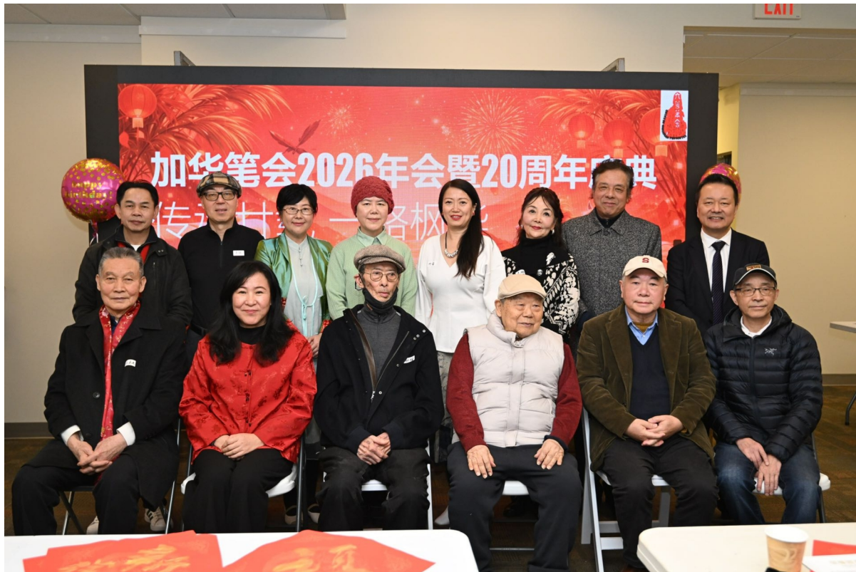
2026年会上，加华笔会历届理事合影