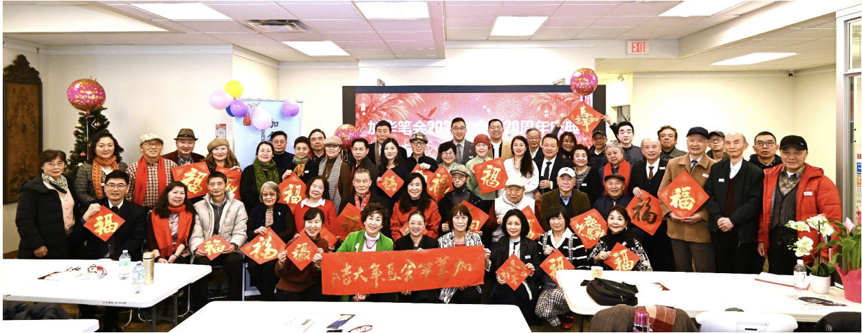
2026年1月24日加华笔会年会暨20周年庆典合影